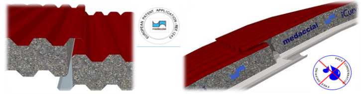
Giunto 'brevettato' longitudinale e trasversale anticondensa